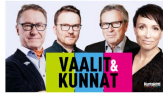
Kuntalehden vaalilahetys: Mikä muuttuu kunnissa – vai muuttuuko? 14.6.2021

Terveisiä Kuntamarkkinoiden osallistujille (Max 4 000 merkkiä sis. välilyönnit. Julkaistaan kumppanisivulla.)